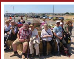
Grŵp Cymorth Cwm Rhondda Uchaf Tudalen 9

Cymorth i Gynhalwyr Achlysuron i Gynhalwyr Cynhalwyr Ifainc Cynhalwyr sy'n Oedolion Ifainc Wilian Rhestr o Achlysuron