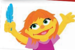
Sesame Street ac Awtistiaeth Tudalen 12