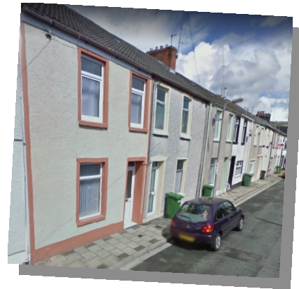
Wayne Street, Aberdare

Un enghraifft o waith da cynllun NYTH yw eiddo yn Aberdâr. Roedd system gwresogi'r tŷ yma'n hŷn na 25 blwydd oed, a doedd dim system gwresogi o gwbl ar lawr cyntaf y tŷ. Doedd dim ffôn yn yr eiddo, a doedd y perchennog ddim yn ymwybodol o gynllun Nyth. Galwodd Swyddog Ynni Tai'r Cyngor heibio i'r eiddo am ymweliad ynglyn â materion eraill. Edrychodd ar yr eiddo a gofynnodd ambell i gwestiwn a ffoniodd Nyth er mwyn gwneud cais am system gwres canolog newydd. O fewn mis, roedd Nyth wedi archwilio'r eiddo, roedd wedi cytuno ar y gwaith ac wedi gosod y system newydd. Roedd hyn yn golygu bod yna gwres yn yr ystafelloedd gwely a boeler combi effeithlon newydd a oedd yn darparu gwres i'r rheiddiaduron newydd. Roedd hyn yn gwneud bywyd yn haws i'r perchennog, ac yn arbed arian iddo. Roedd yr holl welliannau yma am ddim, ac roedd y dyn wedi synnu nad oedd e wedi clywed am y cynllun o'r blaen. Roedd y dyn hefyd wedi synnu pa mor gyflym oedd y broses a'r holl gymorth oedd ar gael iddo.