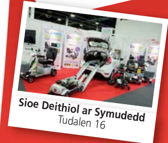
Sioe Deithiol ar Symudedd Tudalen 16