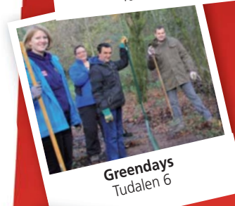
Greendays Tudalen 6