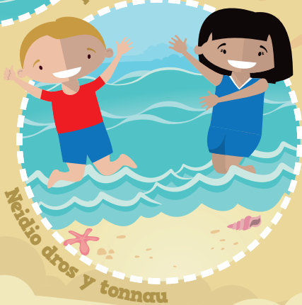
Neidio dros y tonnau