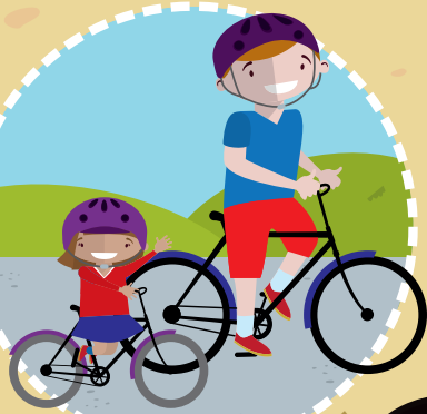
Taith Feicio i'r Teulu