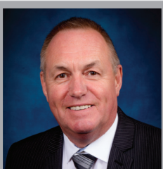
Y Cyngorydd S Powderhill