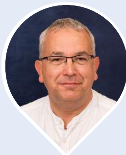
Y Cynghorydd A Cox