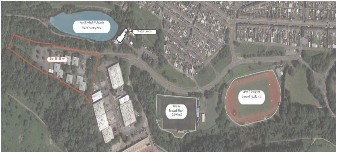
Delwedd o leoliad yr ysgol newydd arfaethedig.

Gobeithiwn y bydd y manau cymunedol ychwanegol a fydd yn rhan o'r ysgol newydd yn golygu bydd y gymuned yn gwneud defnydd mwy o'r ardal.