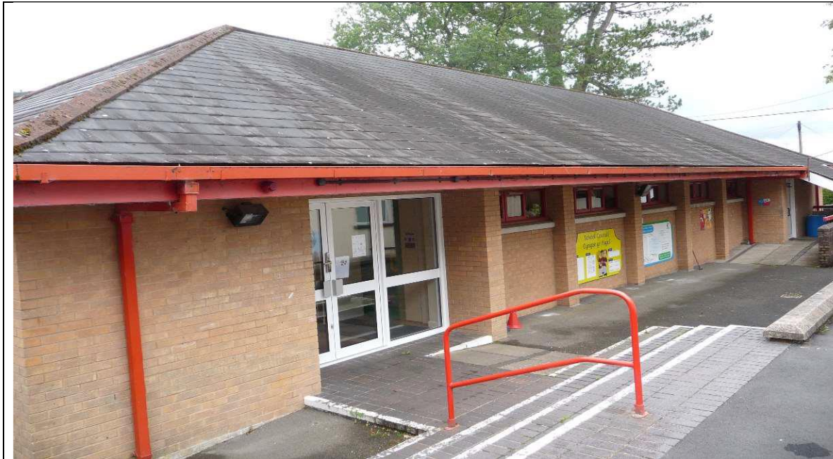
Golygfa allanol o adeilad y neuadd a'r ffreutur

Mae'r tabl dilynol yn amlinellu nifer y disgyblion yn Ysgol Gynradd y Rhigos dros y pum mlynedd academiaidd flaenorol. Cafodd y ffigyrau eu cymryd o'r Cyfrifiad Ysgolion Blynyddol ar Lefel Disgyblion (CYBLD) statudol y mae'n rhaid ei gynnal ym mis Ionawr bob blwyddyn. Caiff niferoedd y disgyblion o oedran meithrin ar gyfer pob blwyddyn academiaidd eu dangos ar wahân, yn unol â Chod Trefniadaeth Ysgolion 2018 Llywodraeth Cymru (011/2018).