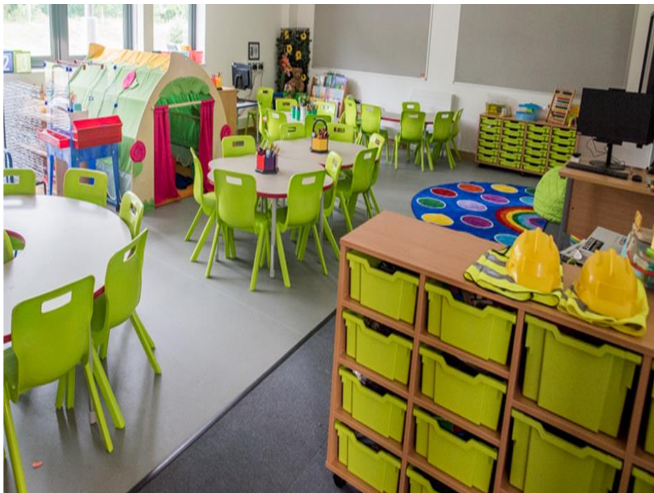
Dosbarth y cyfnod sylfaen yn Ysgol Gynradd Hirwaun.