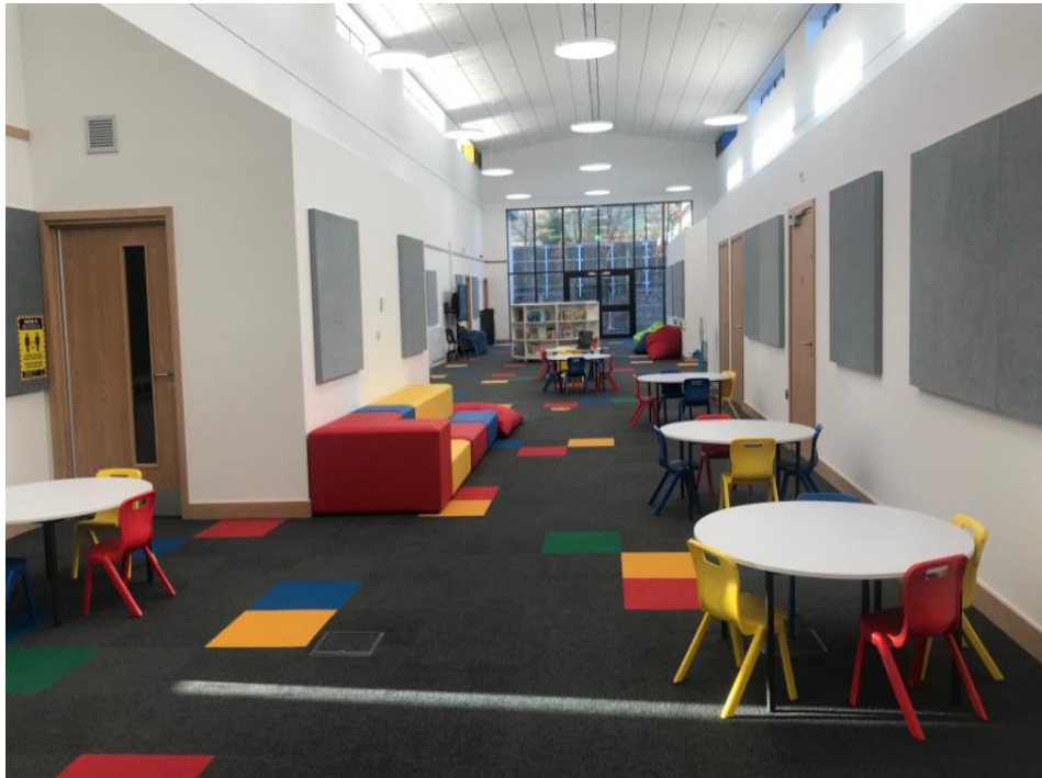
Ardal adnoddau dysgu amlbwrpas neu 'calon yr ysgol' yn Ysgol Gynradd Hirwaun.