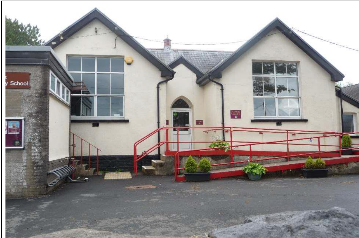
Golygfa allanol o Ysgol Gynradd y Rhigos.