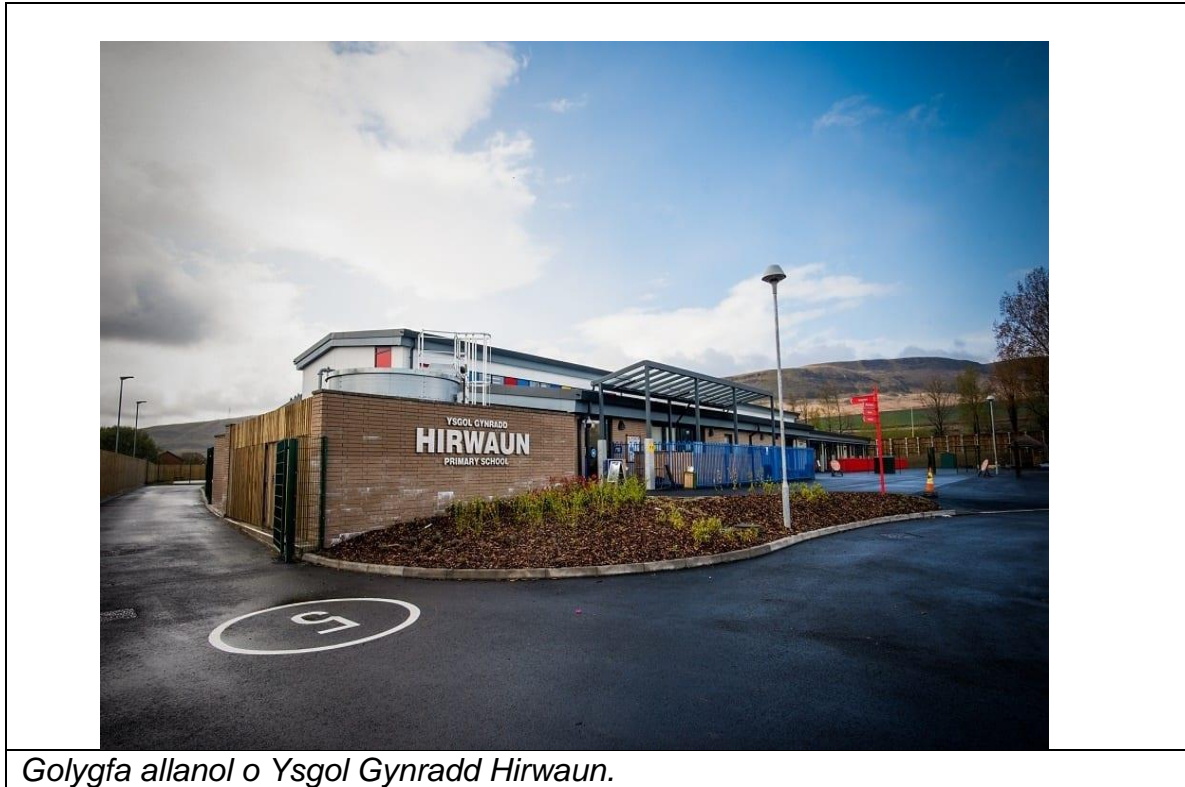
Golygfa allanol o Ysgol Gynradd Hirwaun.

gollwng/casglu pwrpasol ar y safle ar gyfer cludiant o'r cartref i'r ysgol, sydd ar hyn o bryd yn darparu ar gyfer y disgyblion sy'n mynychu o Benderyn.