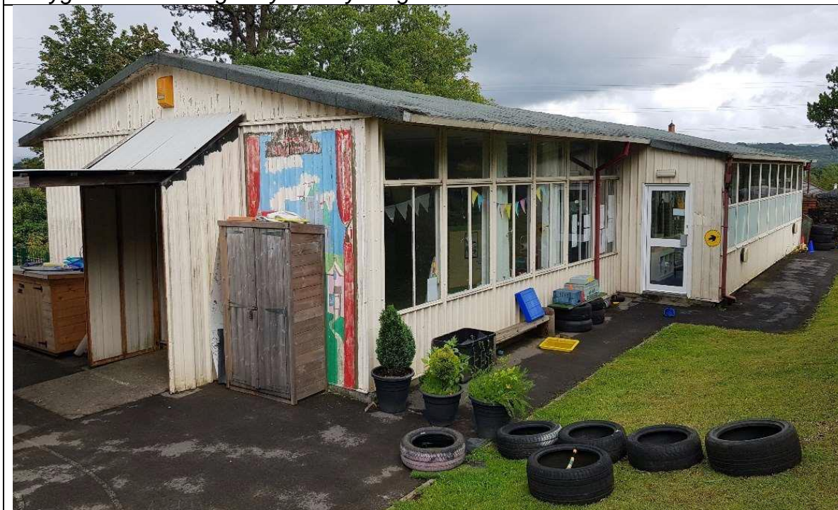
Golygfa allanol o'r adeilad parod metel