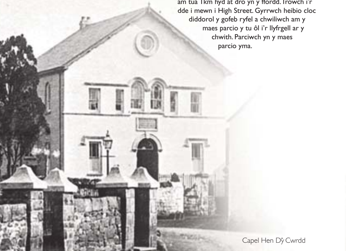
Capel Hen Dŷ Cwrdd

Teithiwch yn ôl i'r A4059 trwy droi i'r chwith ar ddiwedd Alma Street i mewn Mount Pleasant Street, wedyn trowch i'r chwith eto i mewn i Meirion Street ac i lawr y rhiw tuag at gylchfan yr A4059 ar bwys Pont Tramffordd Robertstown. Wrth gyrraedd y gylchfan, trowch i'r chwith tuag at Hirwaun (A4059), gan groesi dwy gylchfan cyn cyrraedd cylchfan fawr yr A465. Cymerwch yr ail dro oddi ar y gylchfan i gyrraedd pentref Hirwaun. Dilynwch y ffordd am tua 1km hyd at dro yn y ffordd. Trowch i'r dde i mewn i High Street. Gyrrwch heibio cloc diddorol y gofeb ryfel a chwiliwch am y maes parcio y tu ôl i'r llyfrgell ar y chwith. Parciwch yn y maes parcio yma.